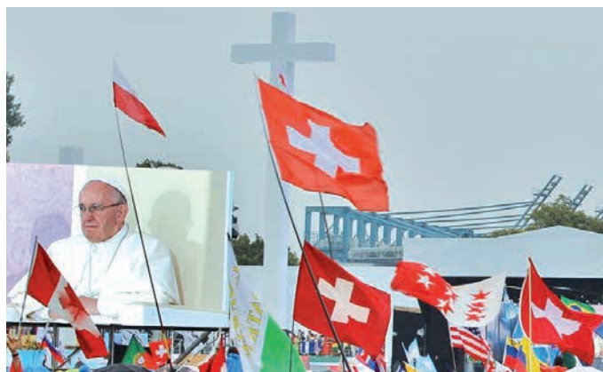
Le pape a-t-il aperçu la petite Suisse ?

C'est l'histoire du canapé qui nous a étonnés. Un pape de quatre fois vingt ans, qui ose soulever une jeunesse 2 millions de fois vingt ans ! Faut voir l'écoute, et la joie qu'ils ont de se sentir responsabilisés, ayant le coach du Christ comme inspirateur, et l'Eglise comme famille universelle. « Jésus n'est pas le Seigneur du confort, de la sécurité et de la commodité. Pour suivre Jésus, il faut avoir une dose de courage, il faut se décider à changer le divan contre une paire de chaussures qui t'aideront à marcher, sur des routes jamais rêvées et même pas imaginées, sur des routes qui peuvent ouvrir de nouveaux horizons, capables de propager la joie, cette joie qui naît de l'amour de Dieu, la joie que laisse dans ton cœur chaque geste, chaque attitude de miséricorde ». (Pape François, veillée du samedi)