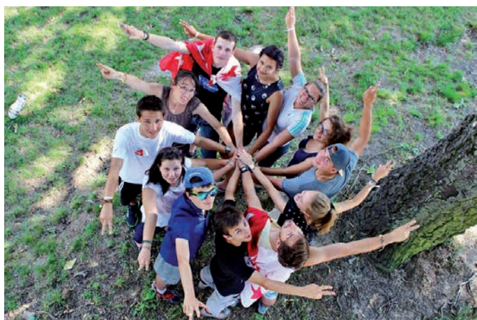
La vie de groupe durant 3 semaines de JMJJ