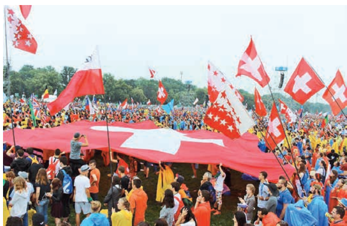
Joye d'avoir une croix sur notre drapeau

Il s'agit de créer des étapes, des lieux, où la foi ou la quête spirituelle peut être entendue et prise en considération. Le réseautage des DJP en Valais offre cette alternative: suffisamment de jeunes qui se connaissent pour ne pas se décourager seul ou à trois dans une paroisse; puis suffisamment de charismes tous jeunes et variés pour créer des événements misant sur le temps des loisirs et osant le créneau de la foi, du témoignage de vie, de la célébration festive. La Pologne, les familles d'accueil, leurs jeunes si nombreux à nous accompagner toute la semaine nous ont convaincus de leur joie et de leur foi, au-delà de tant de mots que l'on n'arrivait pas à comprendre. Mais le Christ est toujours au-delà, intérieur, rassembleur, véritable aimant Aimant!!